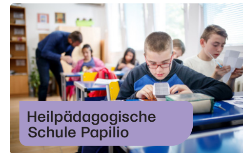
Heilpädagogische Schule Papilio

Das Feedback der Eltern ist durchwegs positiv, wenngleich flexible Strukturen – wie schwankende Präsenzen oder kurzfristige Änderungen – besondere Herausforderungen mit sich bringen.