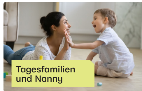
Tagesfamilien und Nanny

Mit diesem Angebot bieten wir Betreuungslösungen in vertrautem Umfeld an. 2025 wurden 6'540 Betreuungsstunden geleistet, davon 6'228 bei Tagesfamilien und 312 im Nanny-Einsatz.