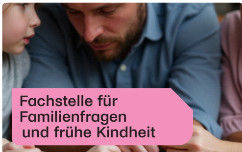
Fachstelle für Familienfragen und frühe Kindheit

2025 wurden 174 Klientinnen und Klienten begleitet – 65 im Bereich Sucht, 109 in der Jugend- und Elternberatung. Präventionsangebote richteten sich an Schulen, Institutionen und die Öffentlichkeit. Zu den Höhepunkten gehörten Elternabende an Urner Oberstufen, Veranstaltungen am Kollegium Karl Borromäus und Projekte rund um Jugendmedienschutz. Für 2026 sind weitere Initiativen geplant – unter anderem eine Veranstaltung zu «Kinder von suchtkranken Eltern» und die Teilnahme am Präventionsprojekt Love-Limits.