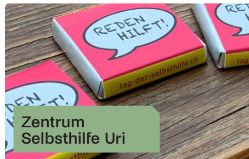
Zentrum Selbsthilfe Uri

Wir sind die zentrale Anlaufstelle für Selbsthilfegruppen im Kanton – für Betroffene, Angehörige und Fachpersonen. Das Zentrum Selbsthilfe Uri fördert Vernetzung im Sozial- und Gesundheitsbereich und ist fest eingebunden ins nationale Netzwerk.