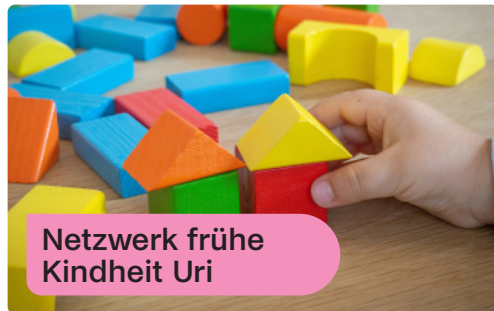
Netzwerk frühe Kindheit Uri

Das Projekt begleitet Familien mit Mehrfachbelastungen von der Schwangerschaft bis zur Einschulung. Als Pilotprojekt (2024 – 2027) verfolgen wir das Ziel, Kinder und Eltern frühzeitig zu stärken und ihnen so einen guten Start in die Schule zu ermöglichen. Gleichzeitig vernetzt es familienunterstützende Angebote im ganzen Kanton Uri.