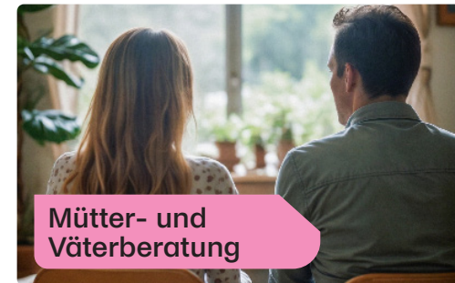
Mütter- und Väterberatung

2025 stieg die Zahl der Anfragen deutlich, weshalb das Team personell erweitert wurde. Neue Aufträge, etwa ein Coachingprojekt des BIZ Uri, erweiterten das Tätigkeitsfeld. Eine anhaltende Herausforderung bleibt die fehlende Finanzierung: Manche Familien können das Angebot trotz Bedarf nicht nutzen.